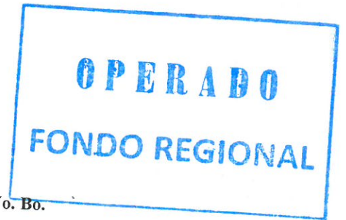
ARQ. SIMON NAJERA NAVA