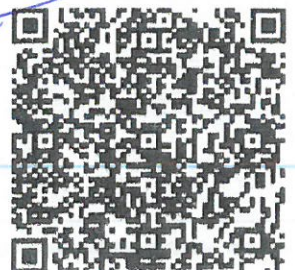
Amparado por los recibos: