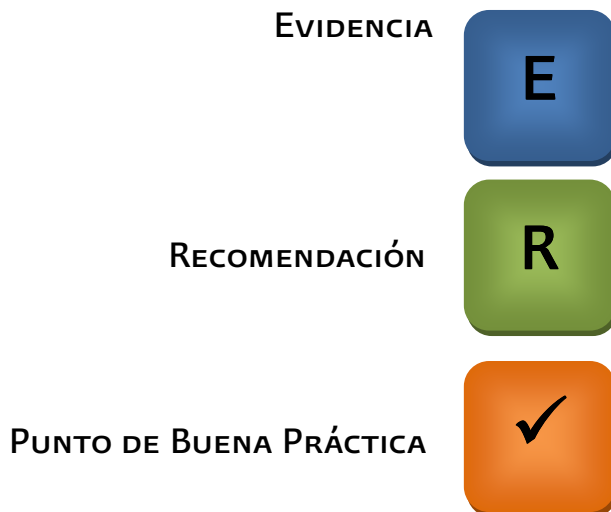
Tabla de referencia de símbolos empleados en esta guía:

Los sistemas de gradación utilizados en la presente guía son: Shekelle, Scottish Intercollegiate y Scheme Given.