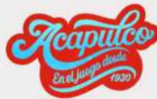
1) Versión con contorno